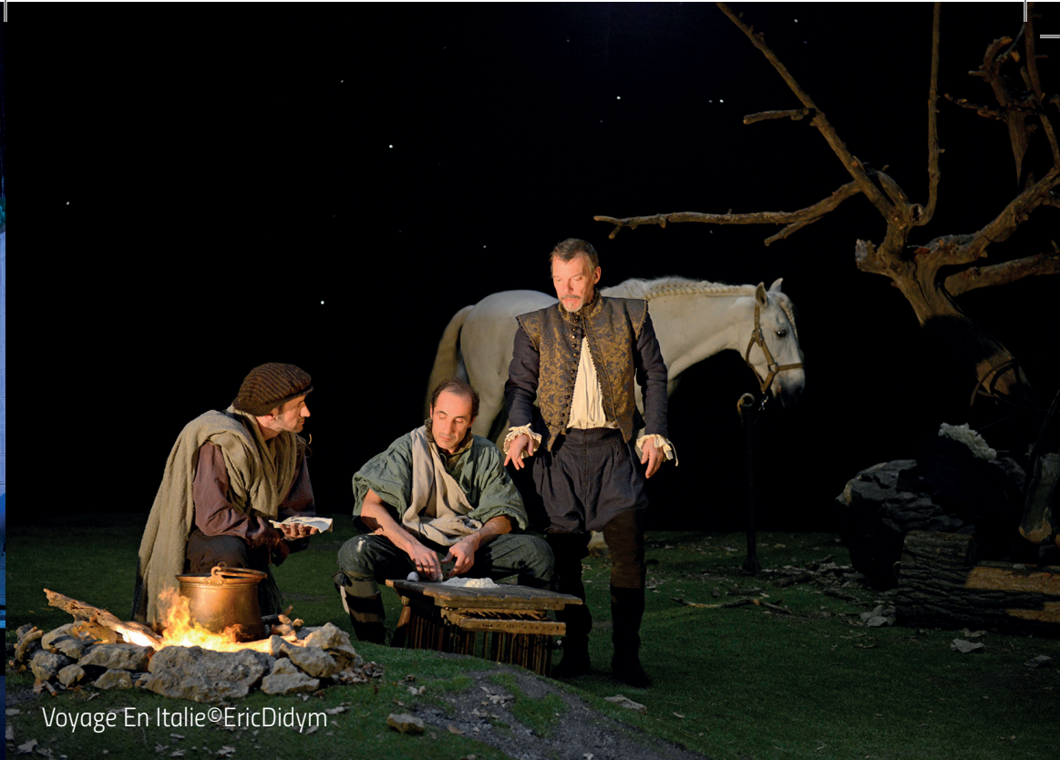
Voyage En Italie